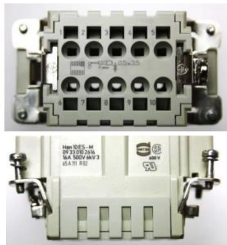
Han® ES (Stifteinsatz)