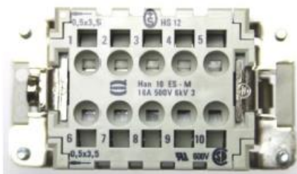
Han® ES (Stifteinsatz)